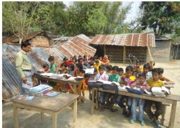
Pictures published on Daily newspapers regarding schools without desirable classrooms where students are compelled to study under extreme natural contexts of Bangladesh