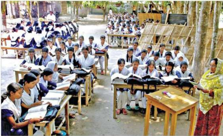
রাজশাহীর পুঠিয়া উপজেলার এস আর বালিকা উচ্চবিদ্যালয়। গাছের ছায়ায় বসে ক্লাস করছে শিক্ষার্থীরা। কোনো বিশৃঙ্খলা নেই, নেই হইচই ❁ ছবি : শহীদুল ইসলাম